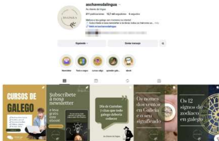
Ilustración 3. Conta de Instagram

Actualmente, As chaves da lingua ten a súa comunidade máis grande en Instagram e goza de máis de 12 000 persoas seguidoras.