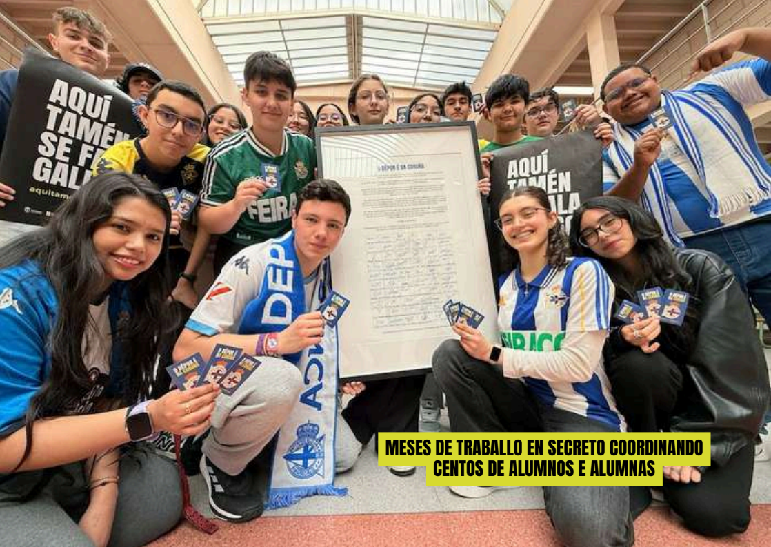
MESES DE TRABAJO EN SECRETO COORDINANDO CENTOS DE ALUMNOS E ALUMNAS